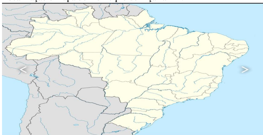
Figura 1 – Localização e mapa do município de Piçarra-PA.

Tradicionalmente considera-se que a colonização de Piçarra iniciou-se na primeira metade do século XX, com a chegada dos primeiros colonos que estabeleceram-se às margens do rio Araguaia. Porém, o território municipal foi habitado por povos indígenas desde tempos imemoriais. Os primeiros contatos com o explorador de origem europeia possivelmente datam do período das entradas e bandeiras, quando muitas expedições desciam o rio Araguaia, vindos das capitanias das Minas Gerais e de São Vicente. Porém não houve uma colonização de fato, houve somente o contato do colonizador com a região no intuito de explorar a força de trabalho nativa, pilhar os recursos naturais, e "civilizar" o nativo (através da catequização) e depois abandonar a região. Não havia o interesse de povoar, mas sim somente usufruir os recursos, e depois de exauridos, abandoná-los.